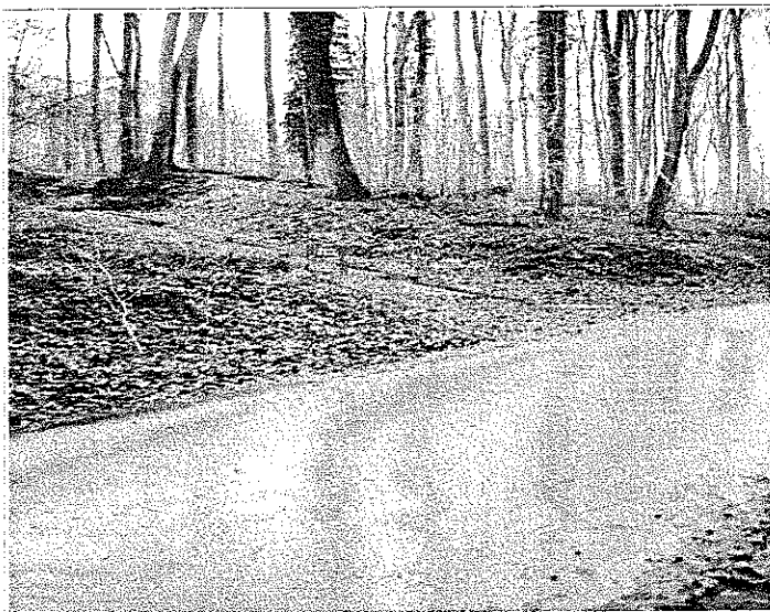
Fontaine Saint-Martin- Commune de Dampleux

Secteur vallée de l'Ourcq, de la Savière et de leurs affluents